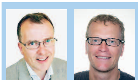
Artikelförfattare är Christian Simmons , Simmons akustik & utveckling AB, Göteborg, och Klas Hagberg , WSP Environmental, Göteborg.

Det har gjorts flera rikstäckande enkätundersökningar som visat hur folk upplever ljudet i sina hus, men de saknade enkäter från nyare hus och det fanns ingen tydlig återkoppling till huskonstruktionerna. Därför har det nu gjorts enkäter i nyare hus, där de boende har satt betyg på sin ljudmiljö. Studien omfattade fem hus med betongstomme och fem hus med trästomme. Vi har även gjort mätningar och beräkningar av ljudisoleringen i husen och jämfört dem med de subjektiva betygen. Jämförelserna leder till flera intressanta slutsatser. Det visar sig, att hus byggda med stommar av betong respektive trä har såväl starka som svaga sidor, men även att det finns stora skillnader mellan byggsystemen. Studien har stöt-